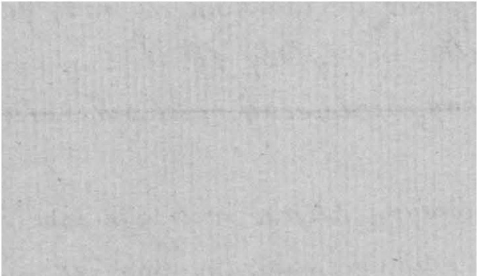
Wycinek niezapisanej strony, pokazujący pionowe ślady papieru żeberkowego.

Umowa jaka miała zostać zawarta pomiędzy dwoma domami nosi tytuł. „Rapport o Interesie JW. Hrabiego Augusta”. Składa się z 17 ponumerowanych stron. Numeracja od 1 do 17 napisana w górnych rogach po prawej nieparzystej w prawym rogu, po parzystej w lewym rogu. Najprawdopodobniej sporządzona na papierze żeberkowym, o czym świadczą widoczne ślady pionowe papieru.